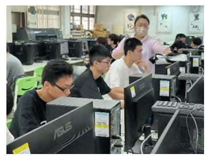
照片 6 說明：檢定考試