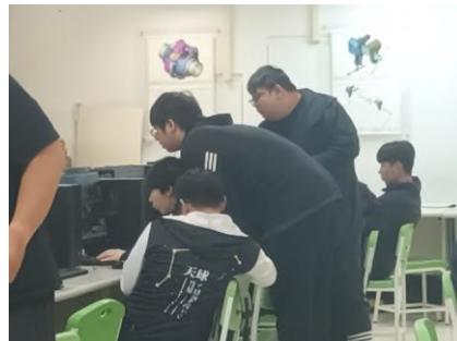
照片 2 說明：分組討論