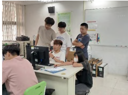
照片 5 說明：設計專案發表