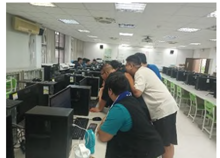
照片 3 說明：分組討論