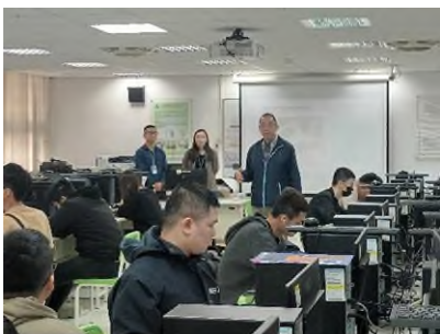
照片 1 說明：邀請廠商分享