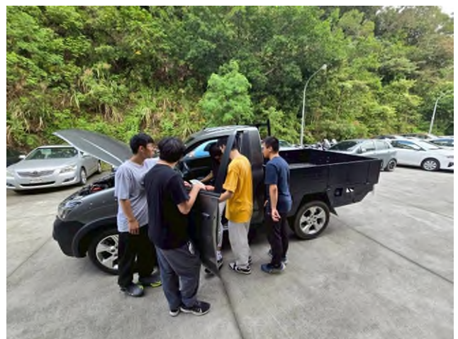
東南科大偏鄉服務專業教育實踐