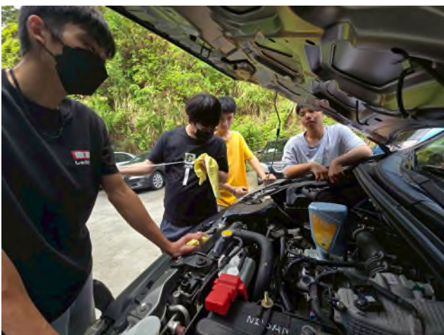
東南科大偏鄉服務專業教育實踐