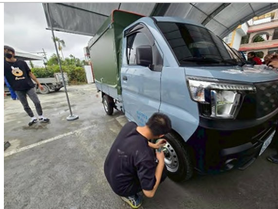
實務技能服務專業實作