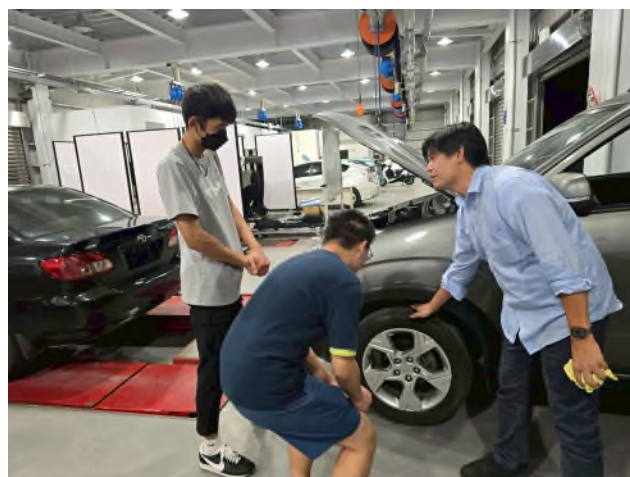
東南科大偏鄉服務專業教育研習