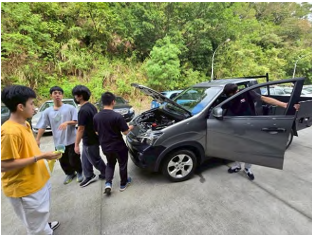
東南科大偏鄉服務專業教育說明