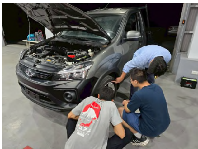
東南科大偏鄉服務專業教育研習