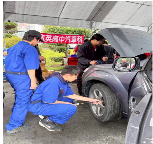
實務技能服務專業實作