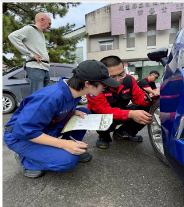
實務技能服務專業實作