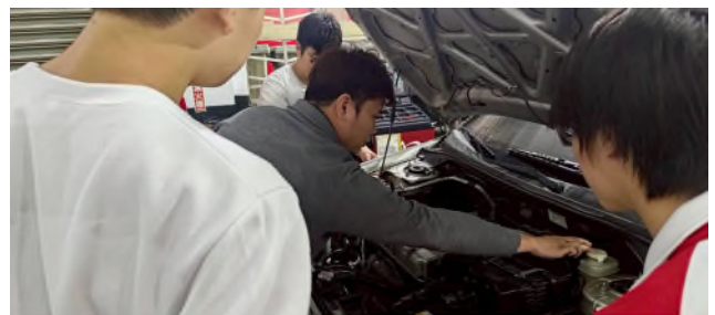
啟英高中行前教育