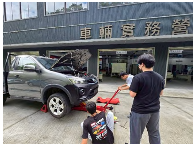
東南科大偏鄉服務專業教育實踐