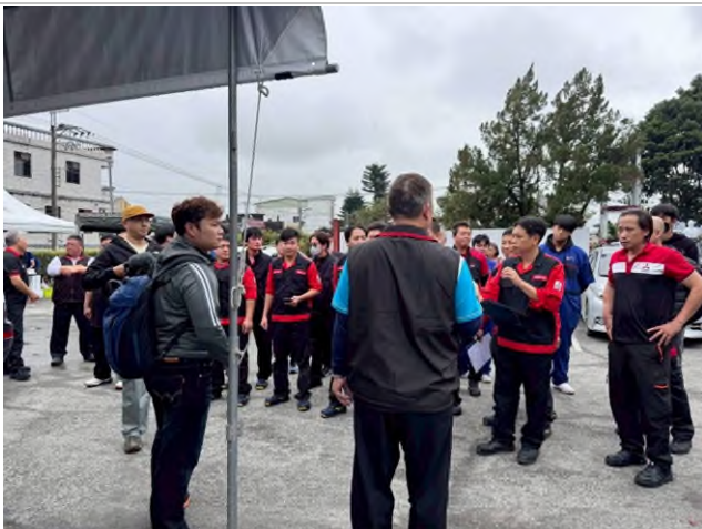
實務技能服務專業實作