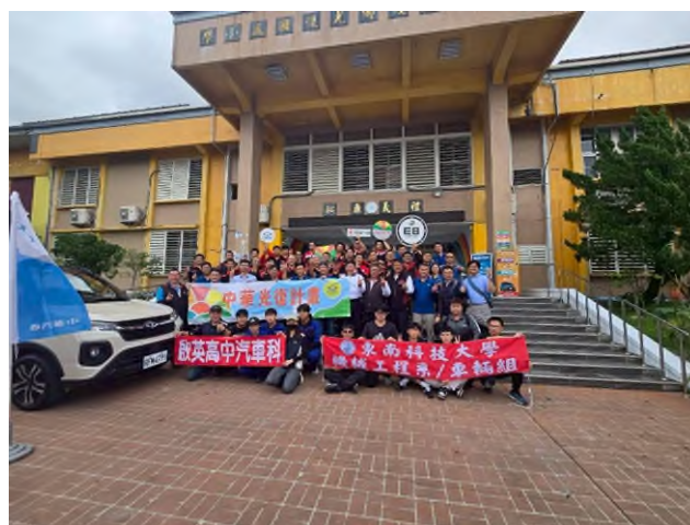
實務技能服務專業實作