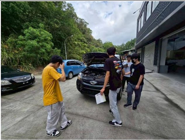
東南科大偏鄉服務專業教育研習