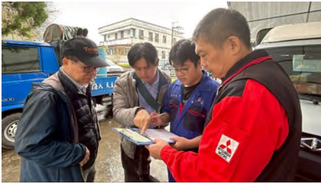
實務技能服務專業實作