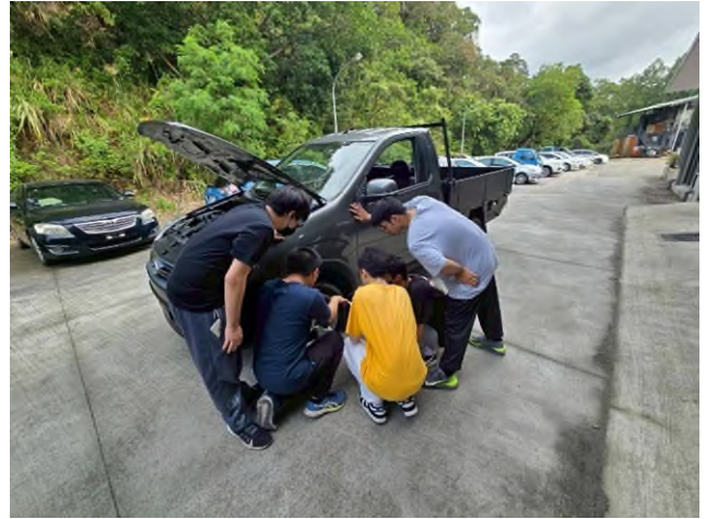
東南科大偏鄉服務專業教育說明