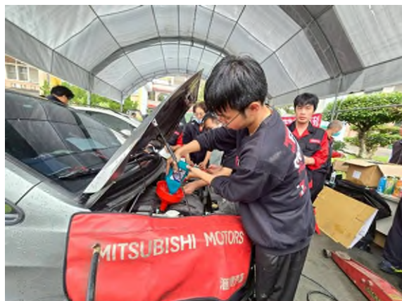
實務技能服務專業實作