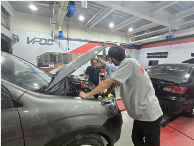
東南科大偏鄉服務專業教育說明