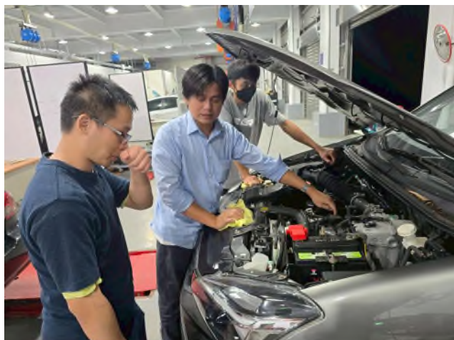
東南科大偏鄉服務專業教育研習