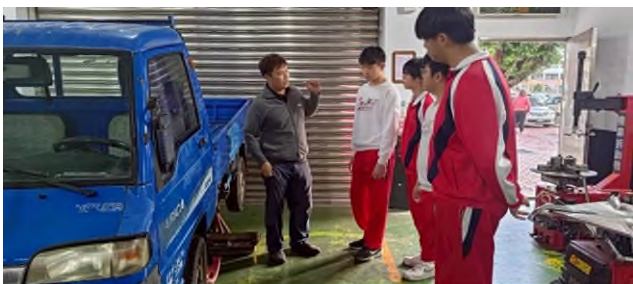
啟英高中行前教育