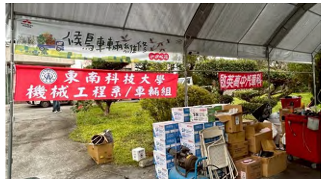
實務技能服務專業實作