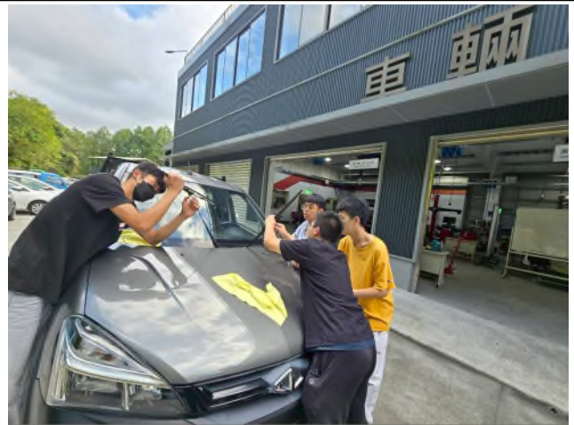
東南科大偏鄉服務專業教育研習