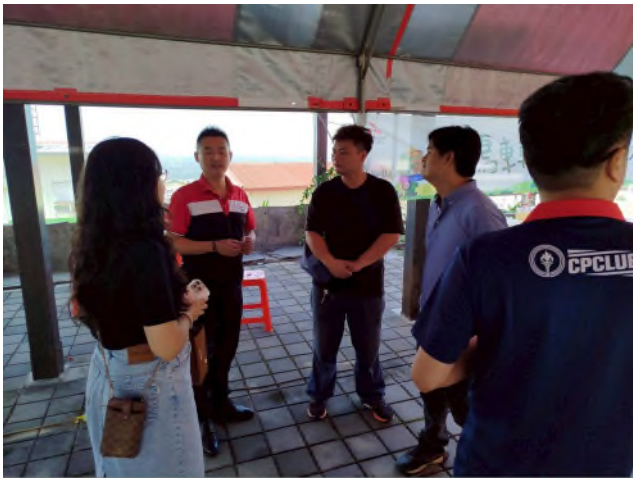
實務技能服務專業實作