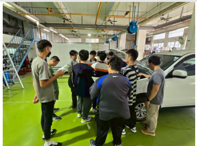
實務技能服務專業實作