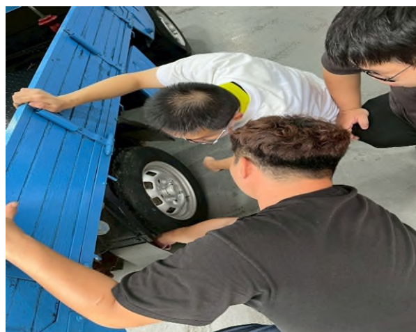
東南科大偏鄉服務專業教育研習