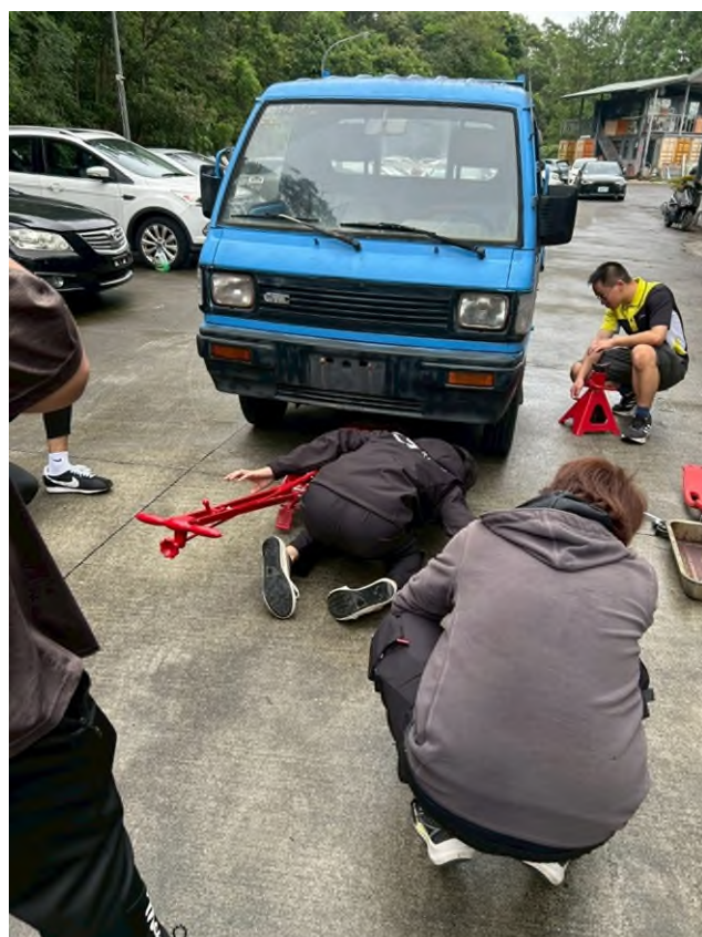
偏鄉服務專業教育研習