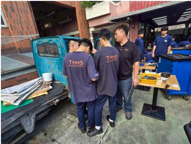
東海高中行前教育