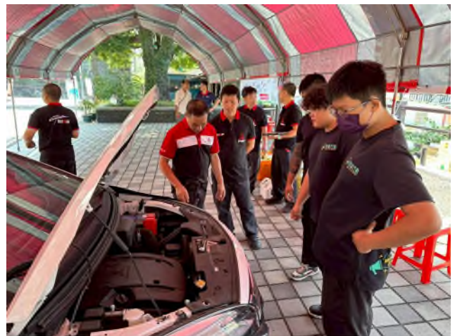
實務技能服務專業實作