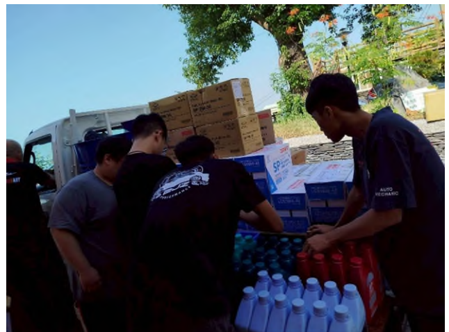
實務技能服務專業實作