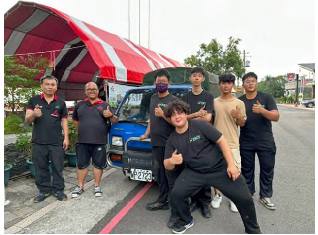
實務技能服務專業實作