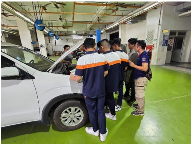
實務技能服務專業實作