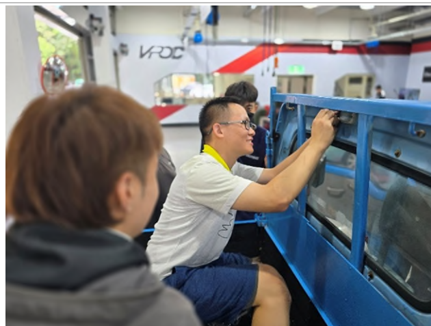
東南科大偏鄉服務專業教育研習