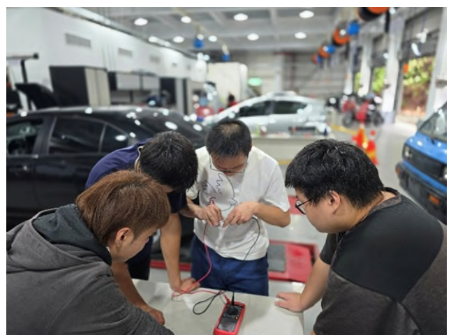
東南科大偏鄉服務專業教育實踐