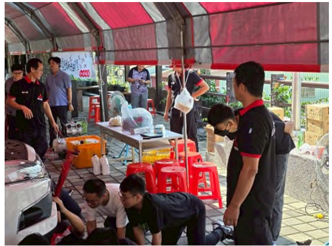
實務技能服務專業實作