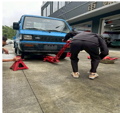
東南科大偏鄉服務專業教育實踐