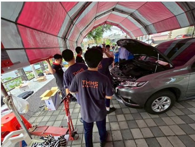
實務技能服務專業實作