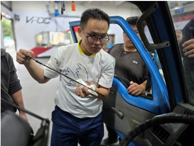
東南科大偏鄉服務專業教育說明