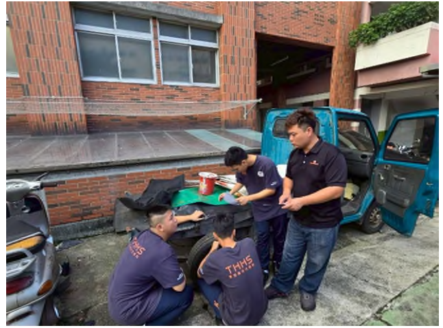
偏鄉服務專業教育研習