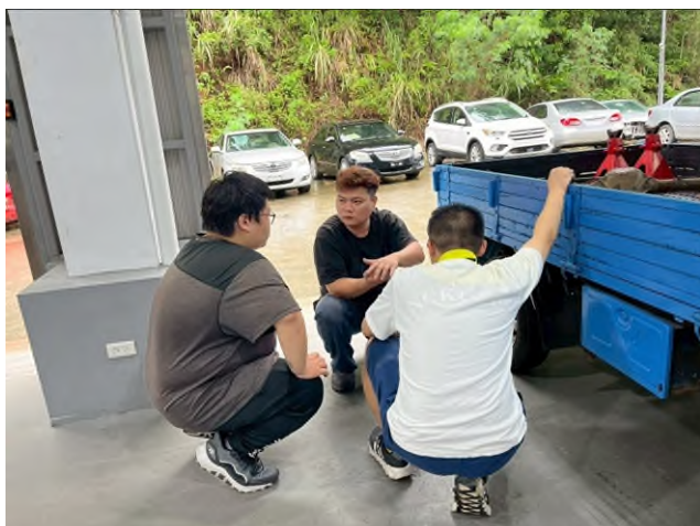
東南科大偏鄉服務專業教育研習