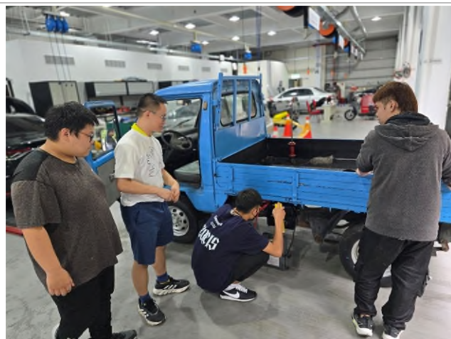
偏鄉服務專業教育研習