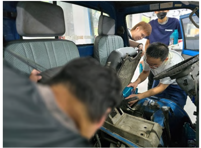
東南科大偏鄉服務專業教育說明