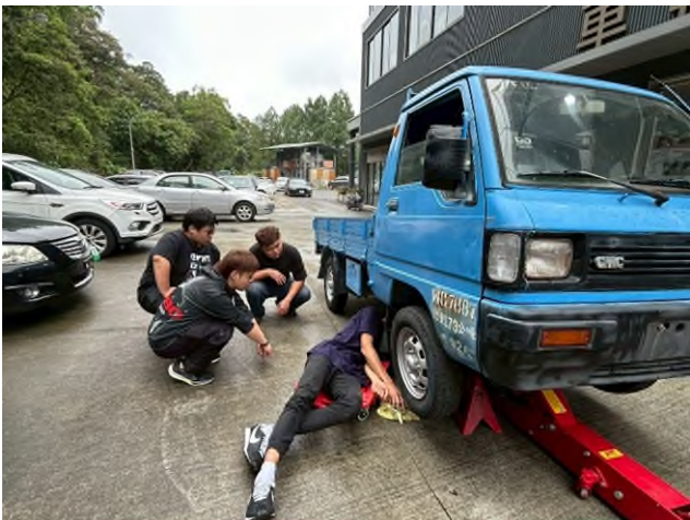
東南科大偏鄉服務專業教育說明