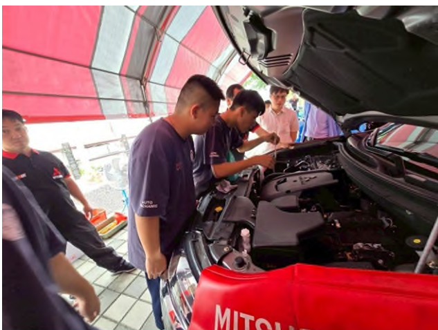
實務技能服務專業實作