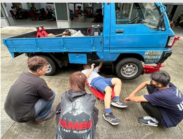
東南科大偏鄉服務專業教育實踐