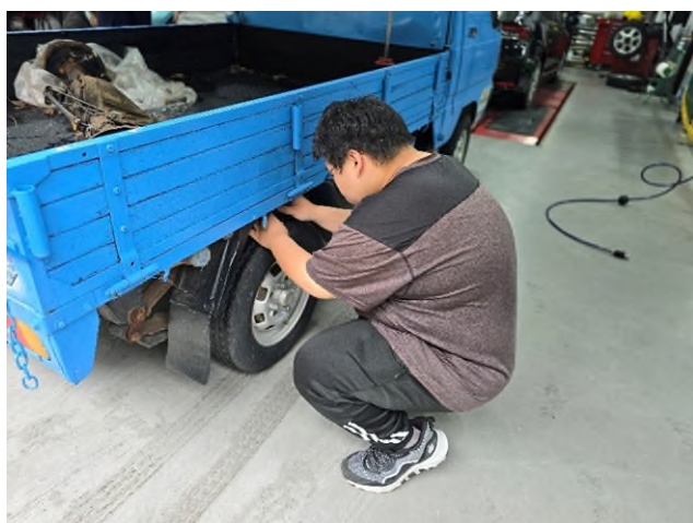
偏鄉服務專業教育研習