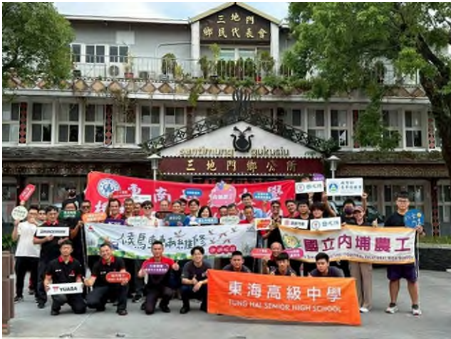
實務技能服務專業實作