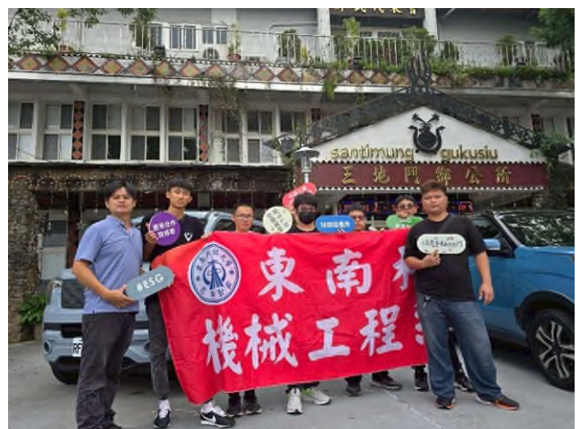
實務技能服務專業實作