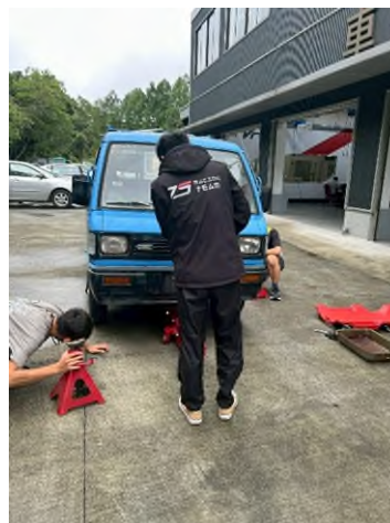
東南科大偏鄉服務專業教育研習