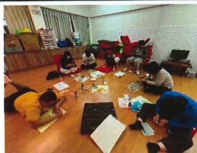
參與職前準備團體