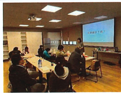
參與職涯工作坊_履歷健檢