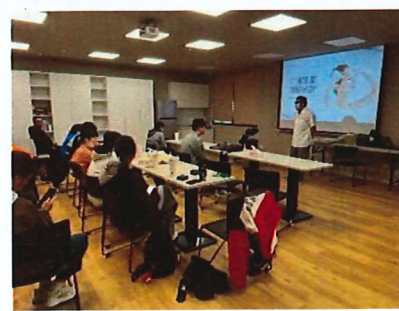
參與職涯工作坊_多元職業探索