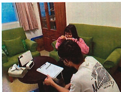
與學生討論輔導需求評估表