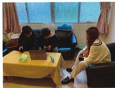
利用線上職涯網站協助學生認識生涯興趣，探索未來就業升學方向