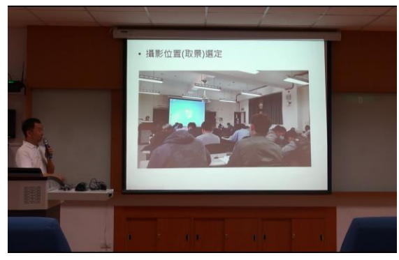
照片 2：拍攝位置選定