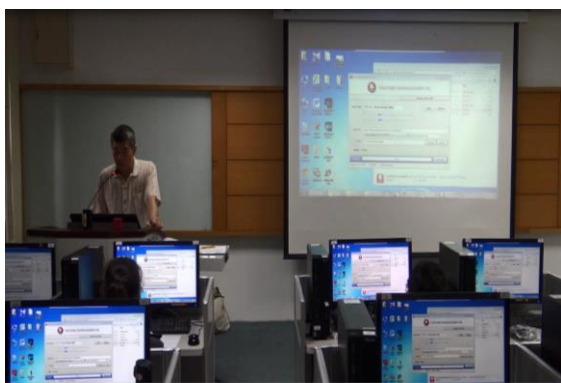
照片 5：軟體安裝方式