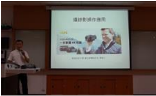
照片 1：攝錄影操作應用