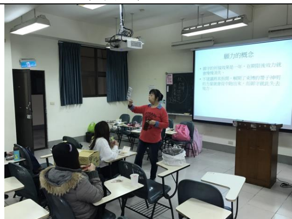
照片說明：園藝治療 DIY 設計