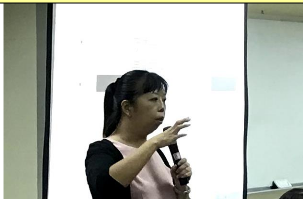
照片說明：老師課程講述