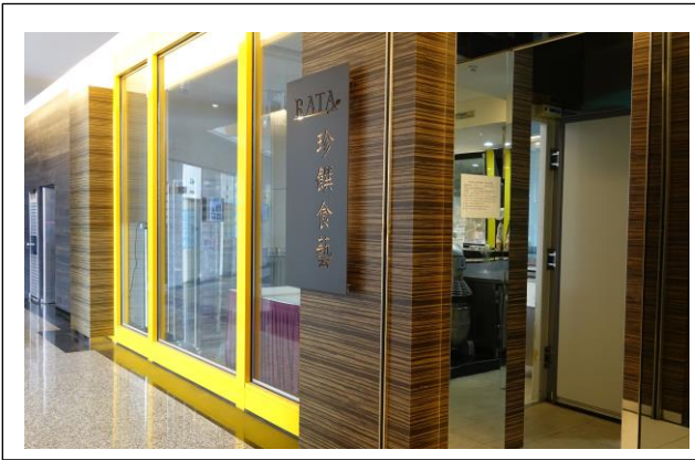
照片 1：RATA 餐廳佈置