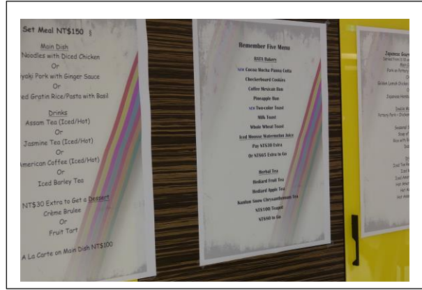
照片 2：RATA 餐廳佈置